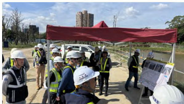
圖 1: 停留點 1 簡報