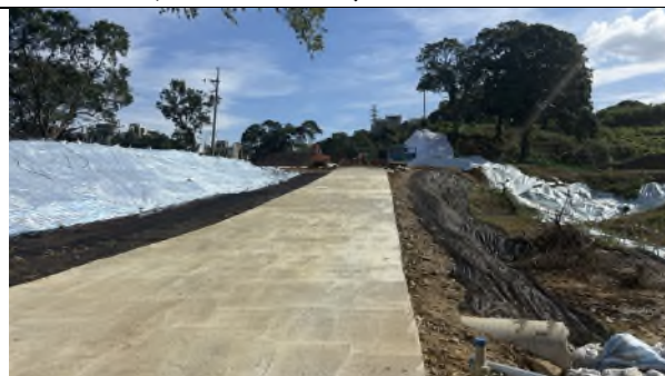
圖 4: 停留點 2 現勘增設施工便道及減作 10、12 及 13 號擋土排樁