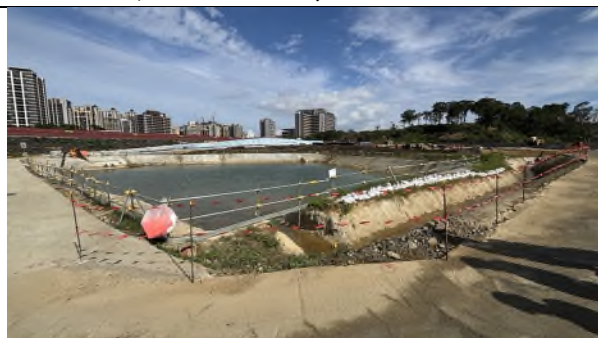
圖 3: 停留點 1 現勘減作 8 號擋土排樁及增設臨時排水路