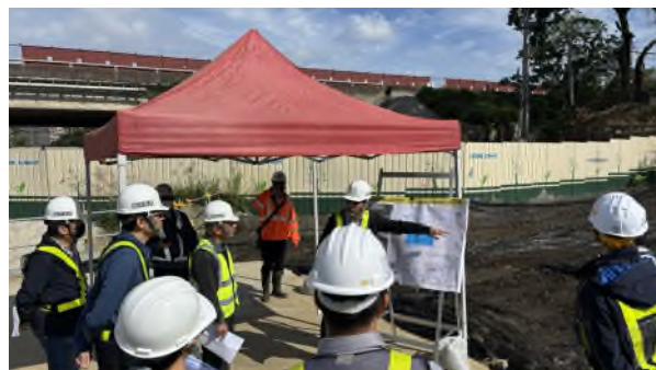
圖 2: 停留點 2 簡報